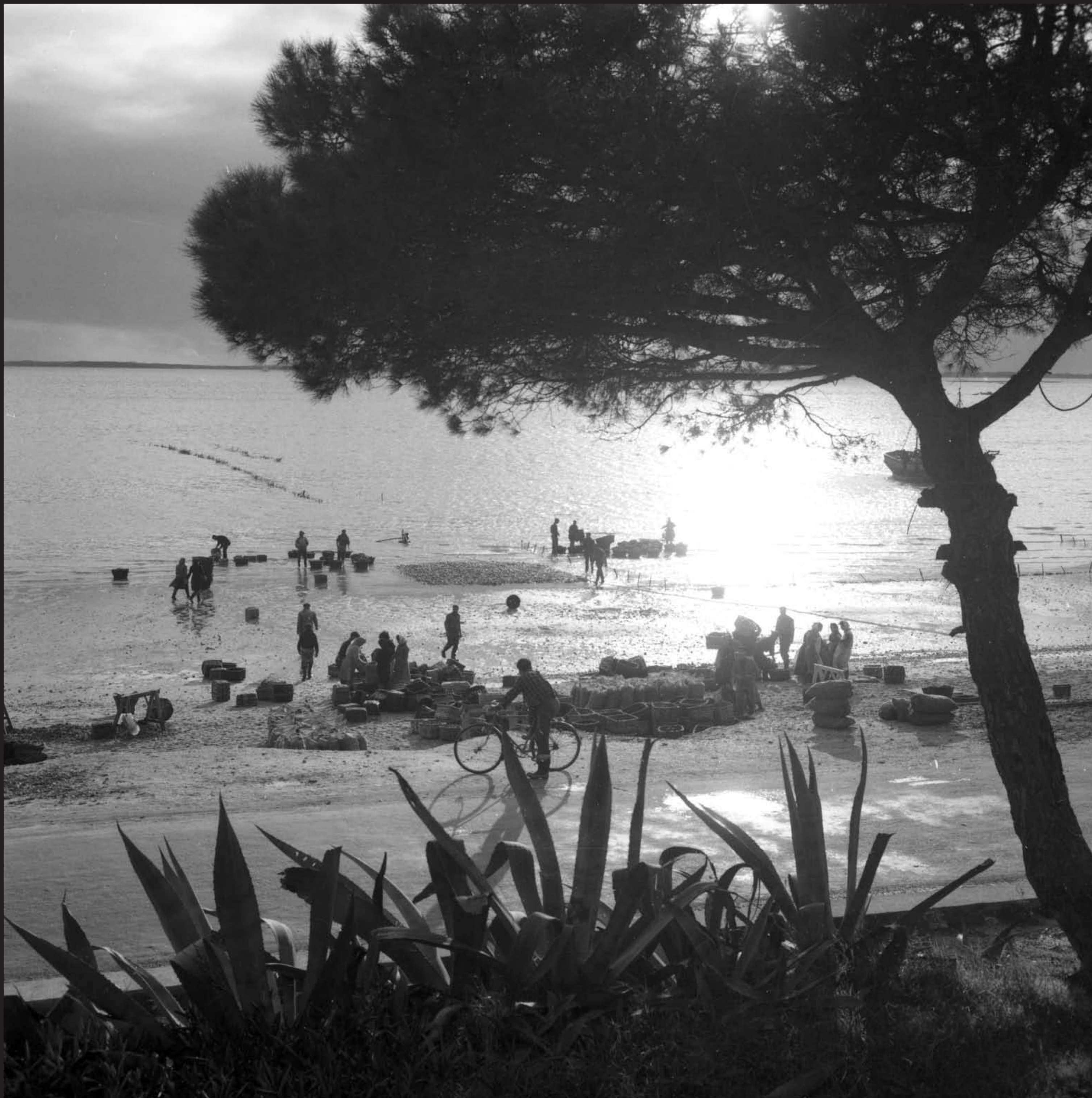
Américo Ribeiro, Apanha das Ostras em Santa Catarina, nº 10441, 1955