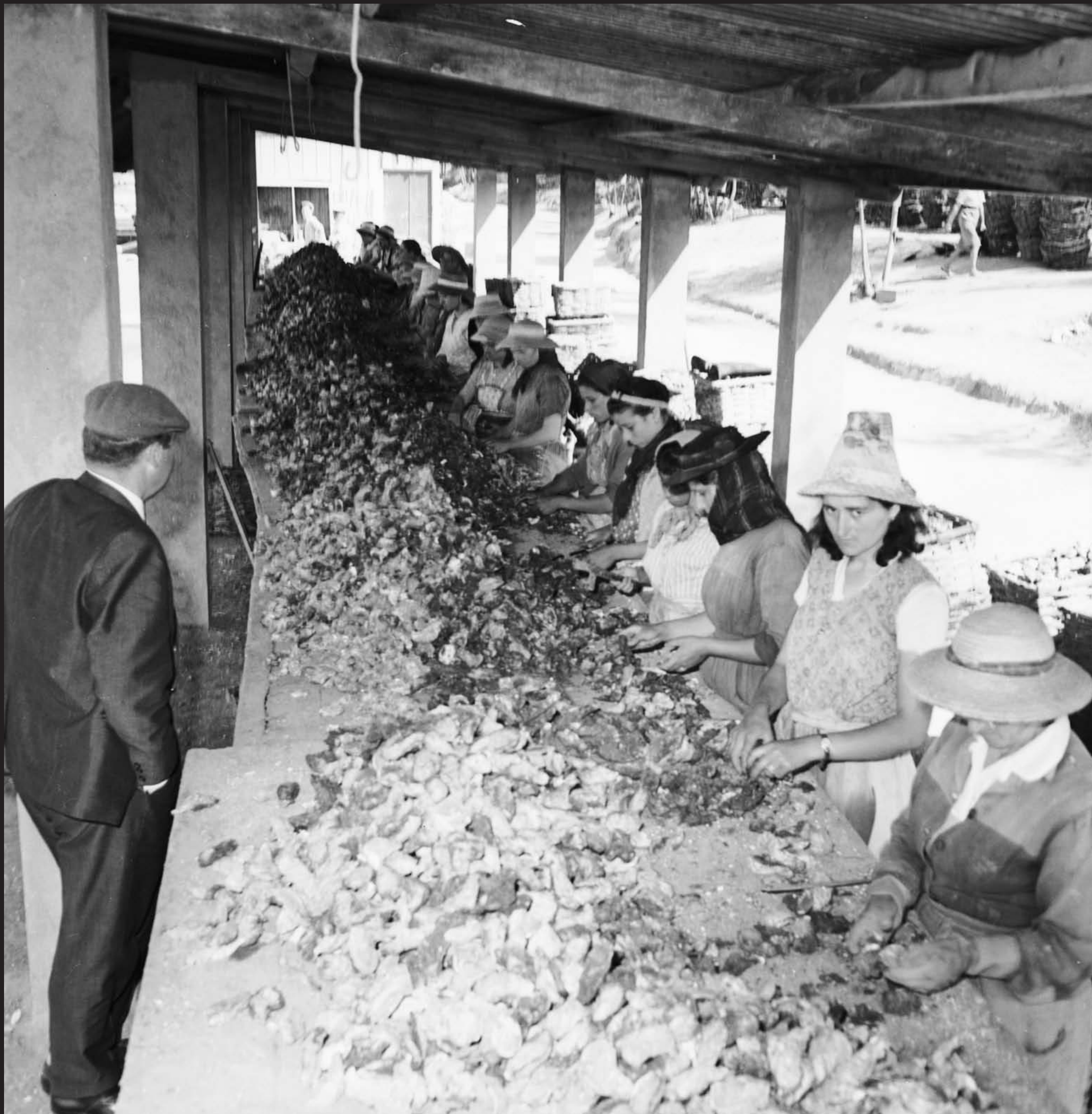
Américo Ribeiro, Ostras em Santa Catarina, nº 13059, 1963 Arquivo Fotográfico Américo Ribeiro | Divisão de Museus | Câmara Municipal de Setúbal