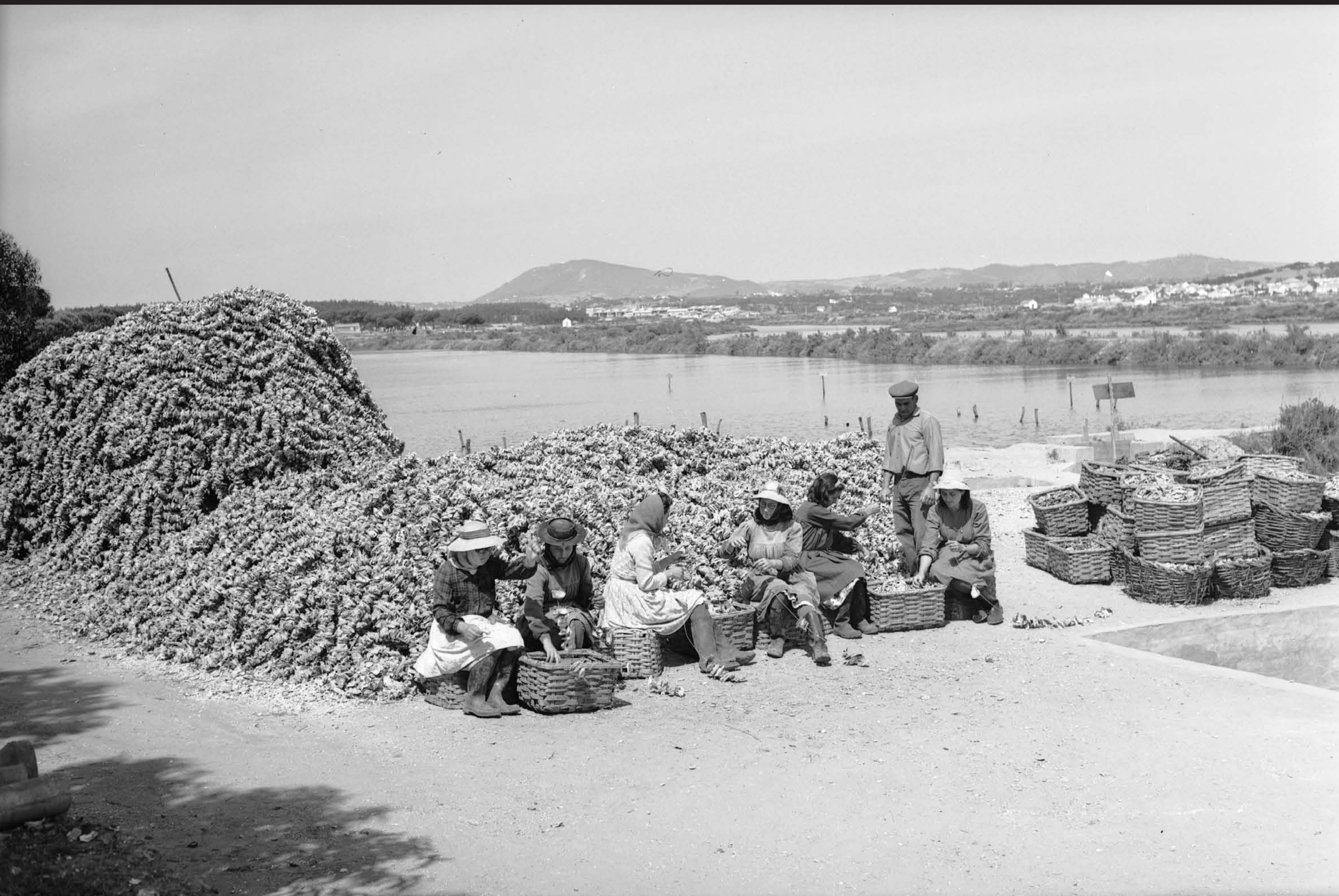
Américo Ribeiro, Ostreiras em Santa Catarina , nº 13059, 1963 Arquivo Fotográfico Américo Ribeiro | Divisão de Museus | Câmara Municipal de Setúbal