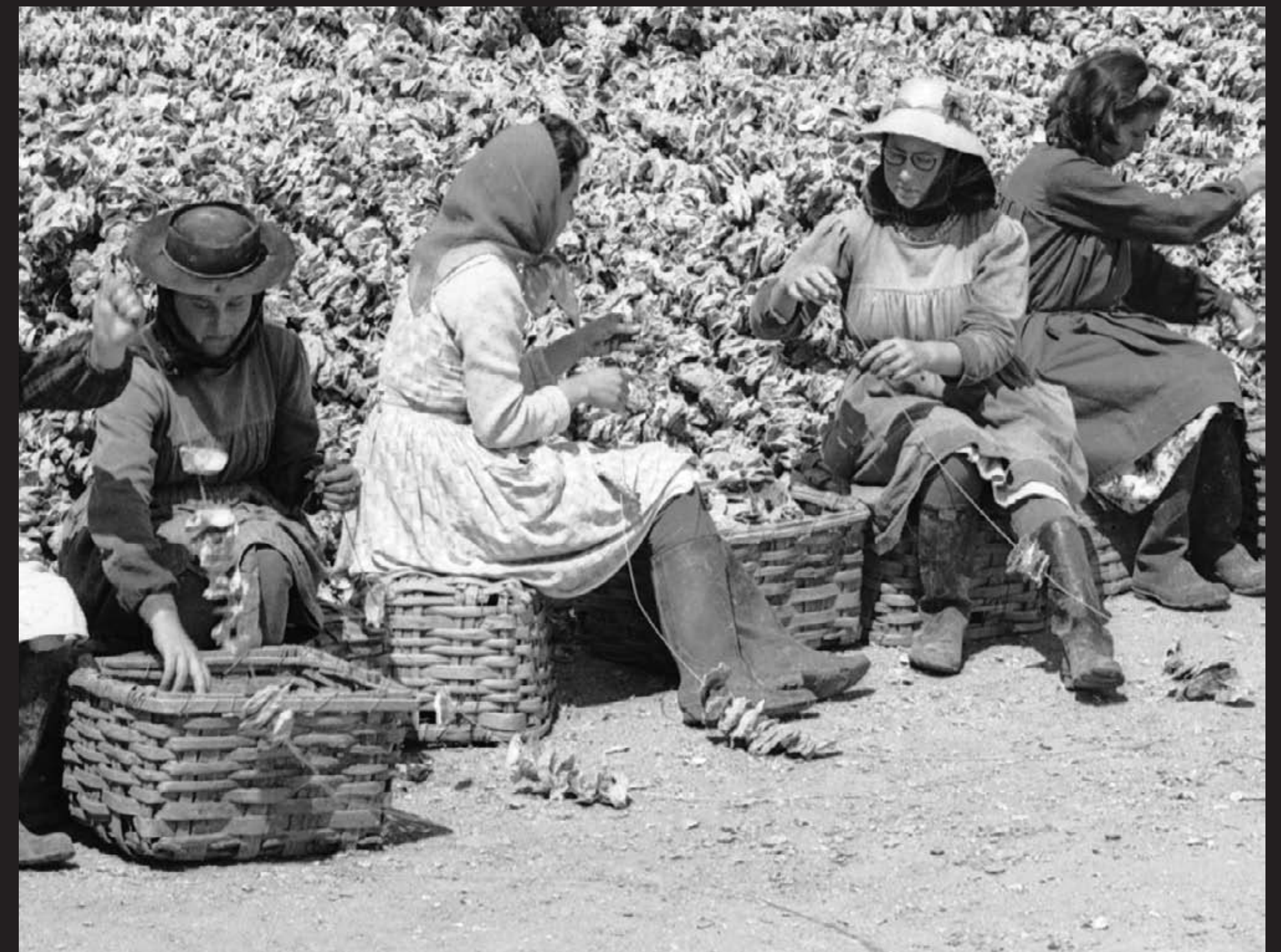
Américo Ribeiro, Apanha das Ostras em Santa Catarina (pormenor), nº 13059, 1963 Arquivo Fotográfico Américo Ribeiro | Divisão de Museus | Câmara Municipal de Setúbal