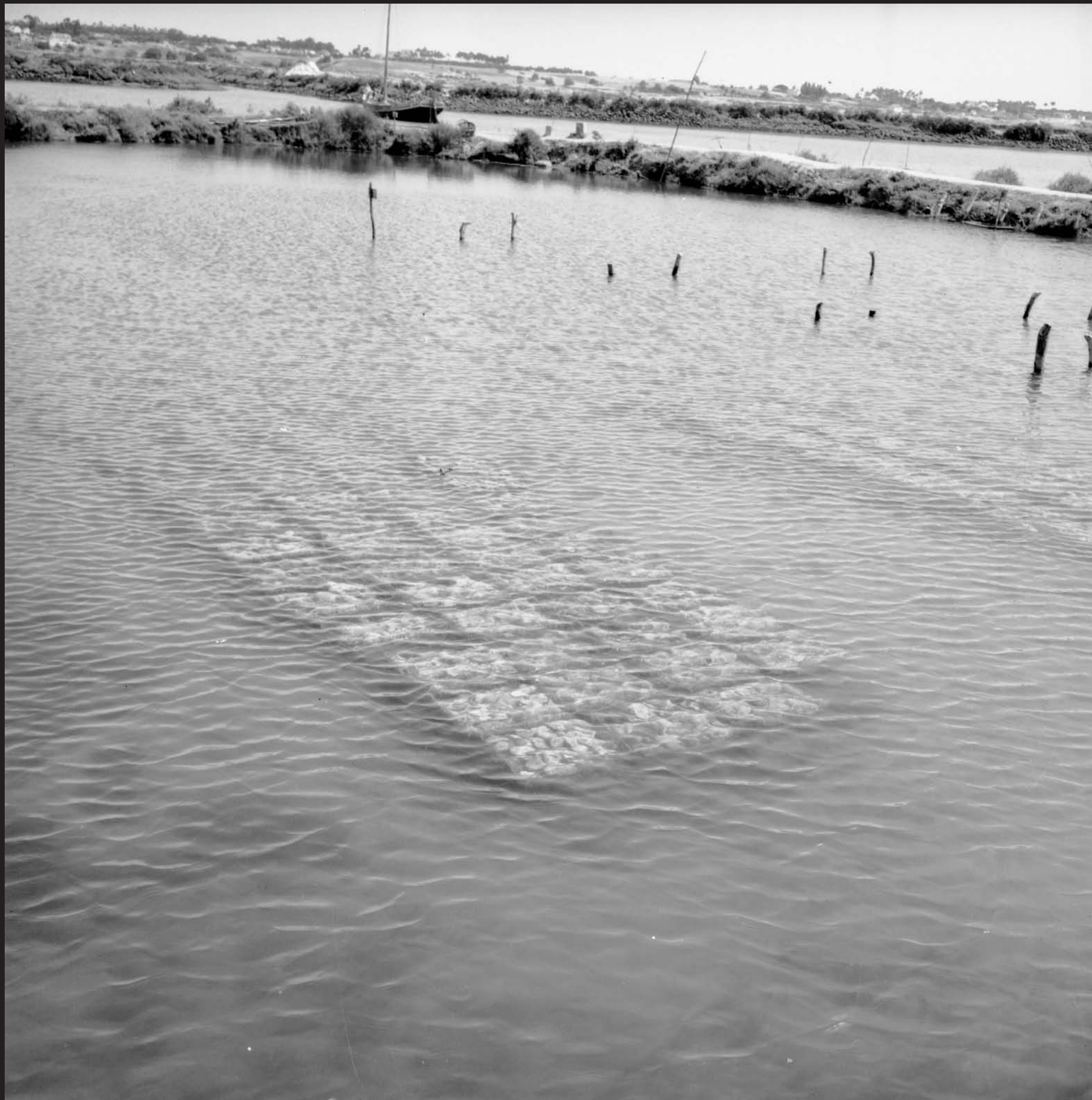
Américo Ribeiro, Ostreiras em Santa Catarina, nº 13059, 1963 Arquivo Fotográfico Américo Ribeiro | Divisão de Museus | Câmara Municipal de Setúbal