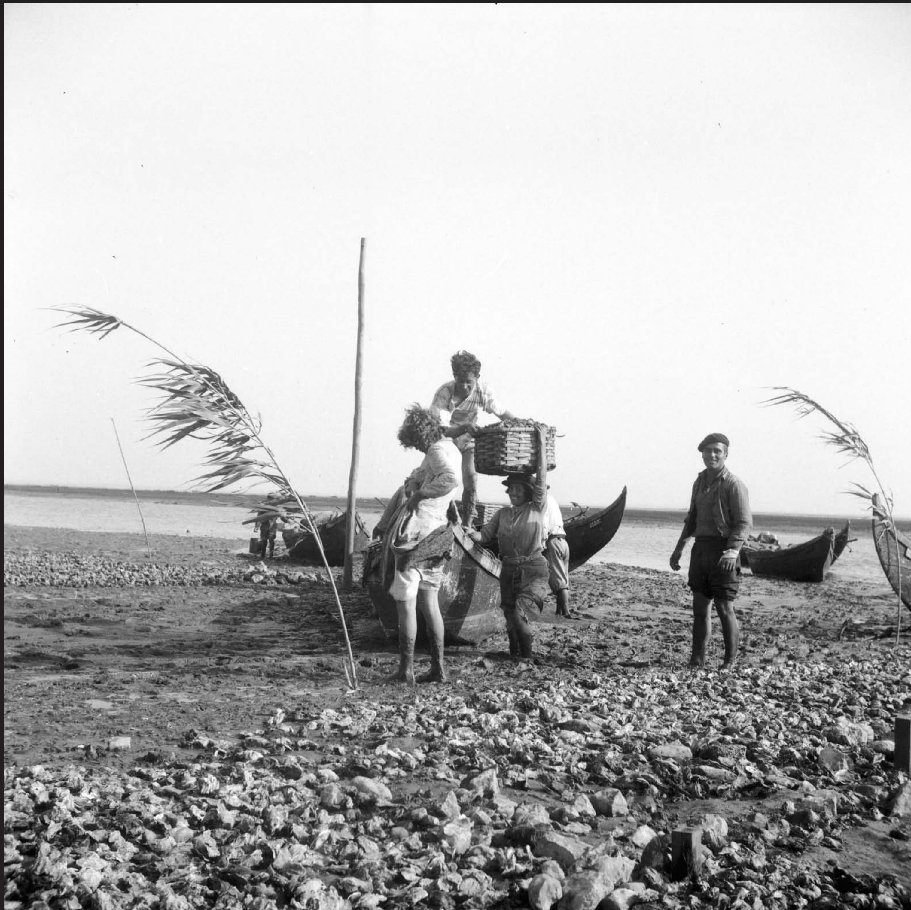
Américo Ribeiro, Apanha das Ostras em Santa Catarina, nº 10441, 1955