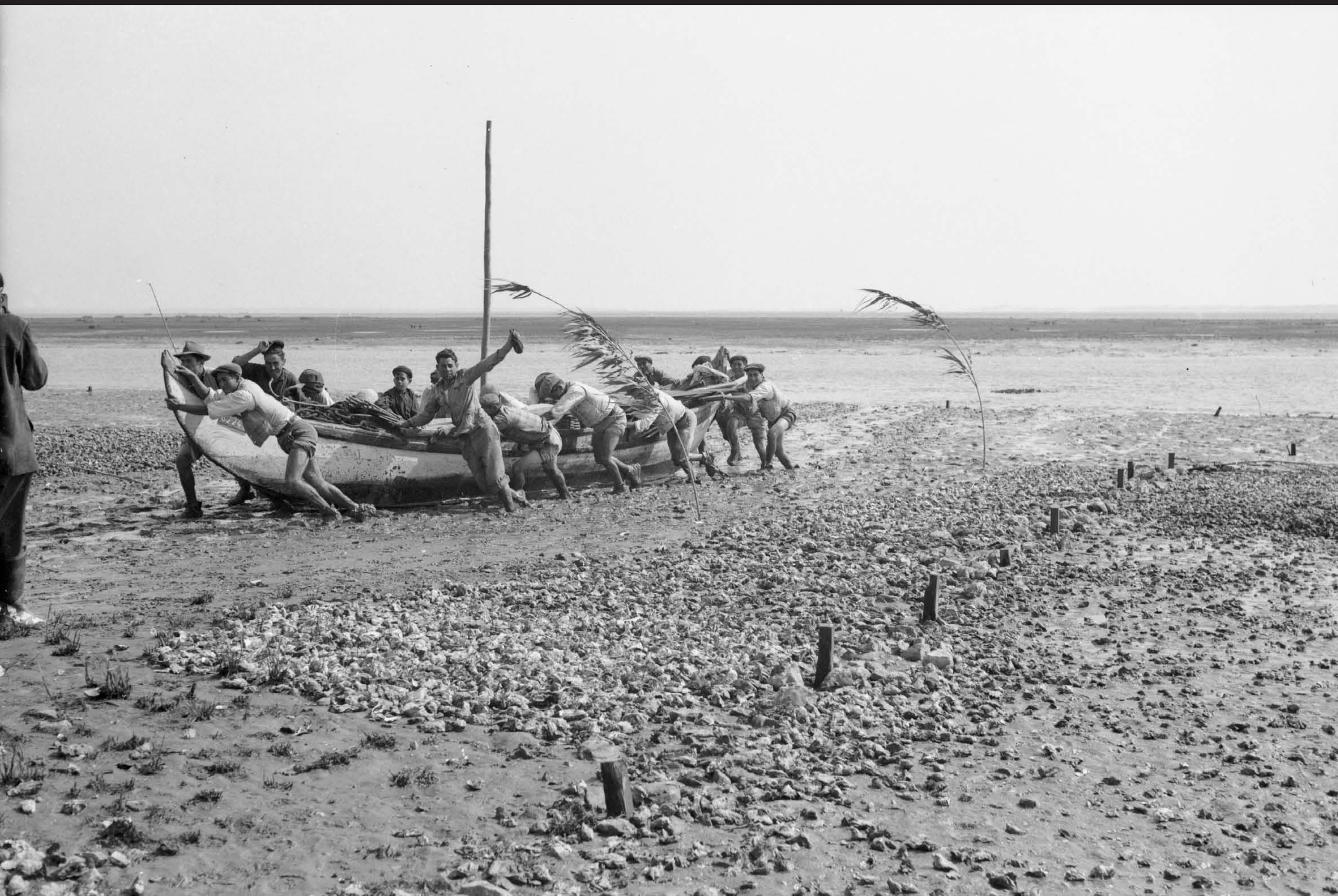
Américo Ribeiro, Apanha das Ostras em Santa Catarina, nº 10441, 1955 Arquivo Fotográfico Américo Ribeiro | Divisão de Museus | Câmara Municipal de Setúbal