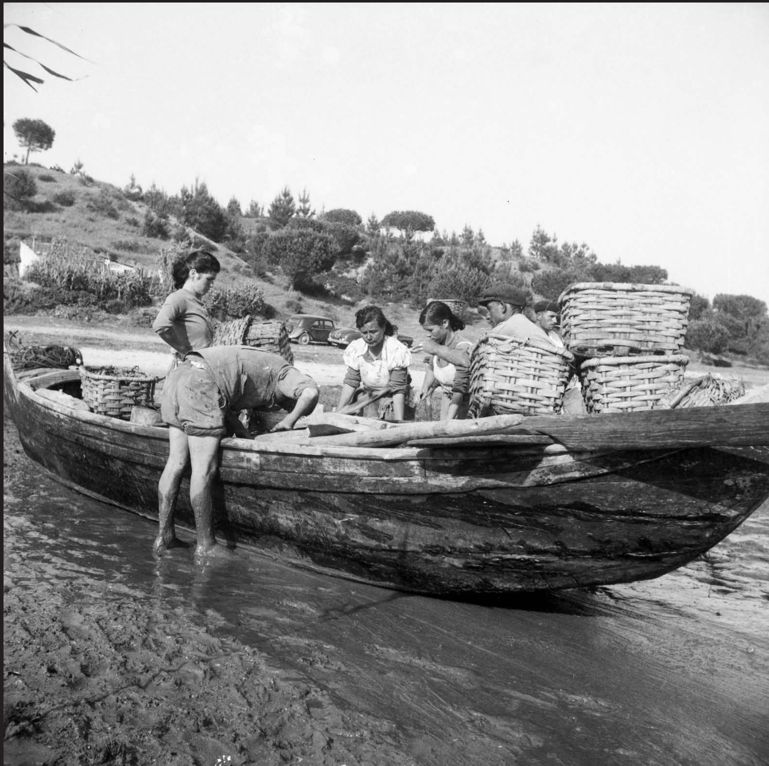
Américo Ribeiro, Ostreiras em Santa Catarina, nº 13059, 1963 Arquivo Fotográfico Américo Ribeiro | Divisão de Museus | Câmara Municipal de Setúbal