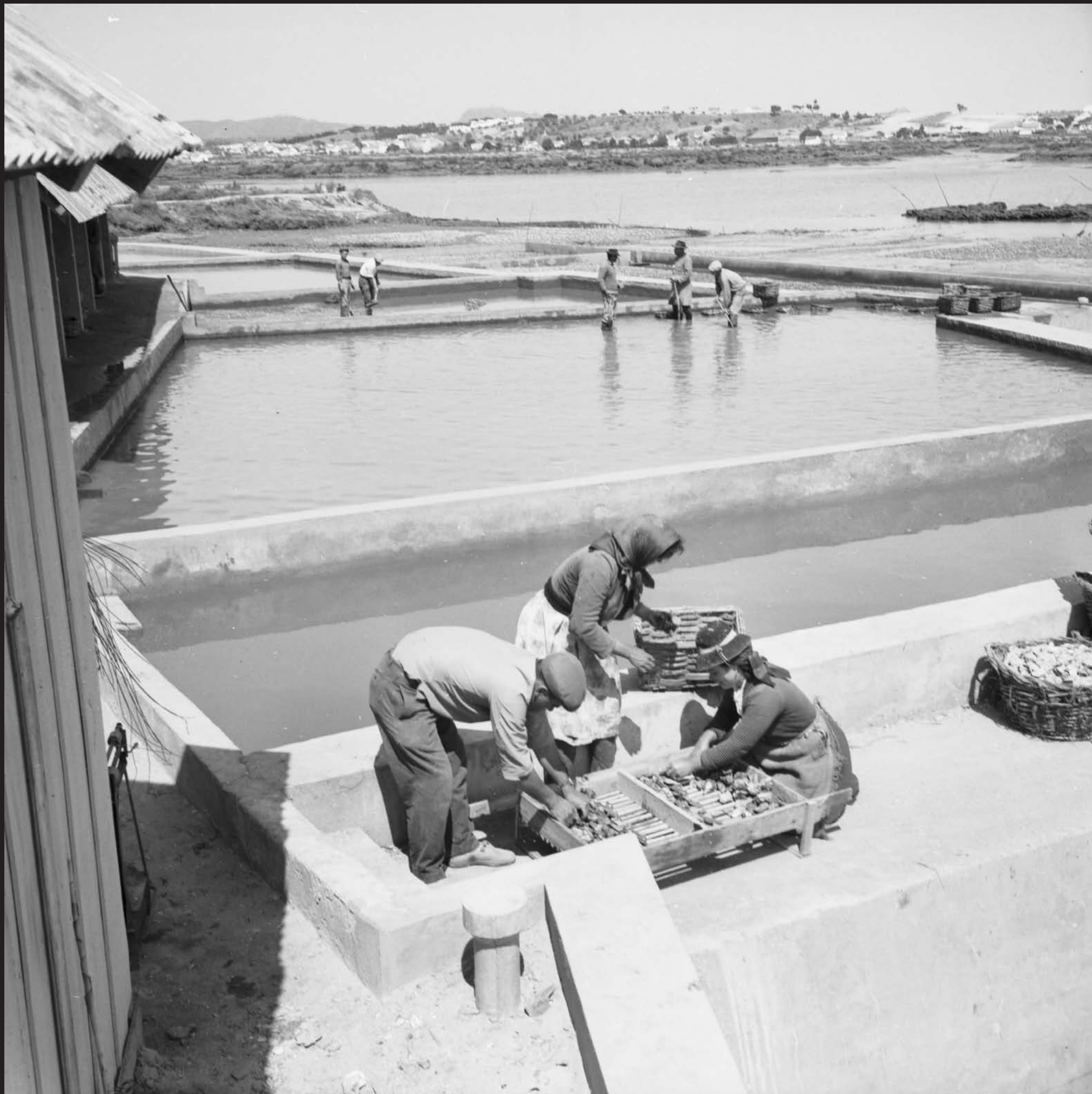
Américo Ribeiro, Ostreiras de Sérgio Pintado (sítio Marinha da Longa), nº 13335, 1965 Arquivo Fotográfico Américo Ribeiro | Divisão de Museus | Câmara Municipal de Setúbal