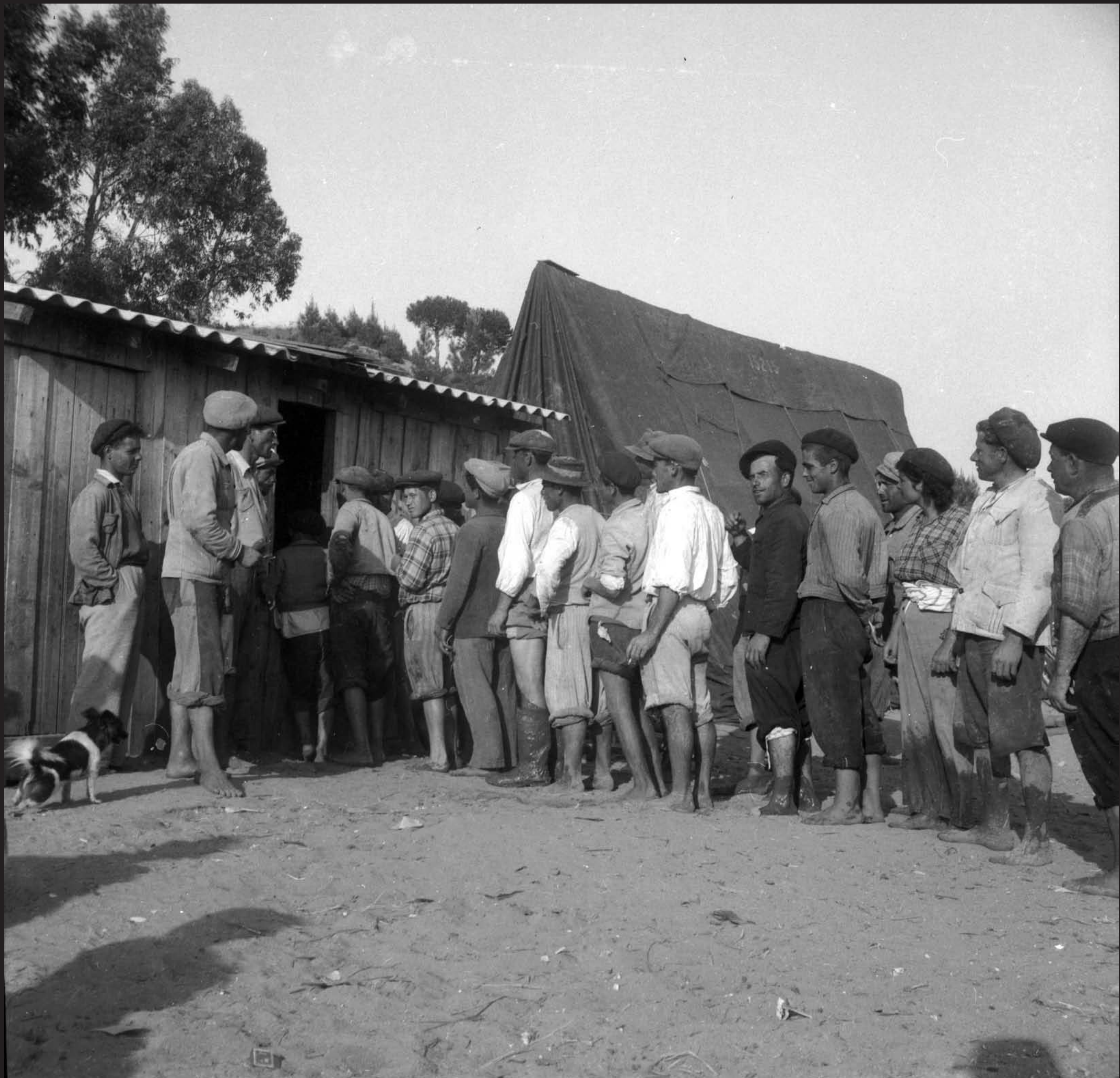
Américo Ribeiro, Apanha das Ostras em Santa Catarina, nº 10441, 1955