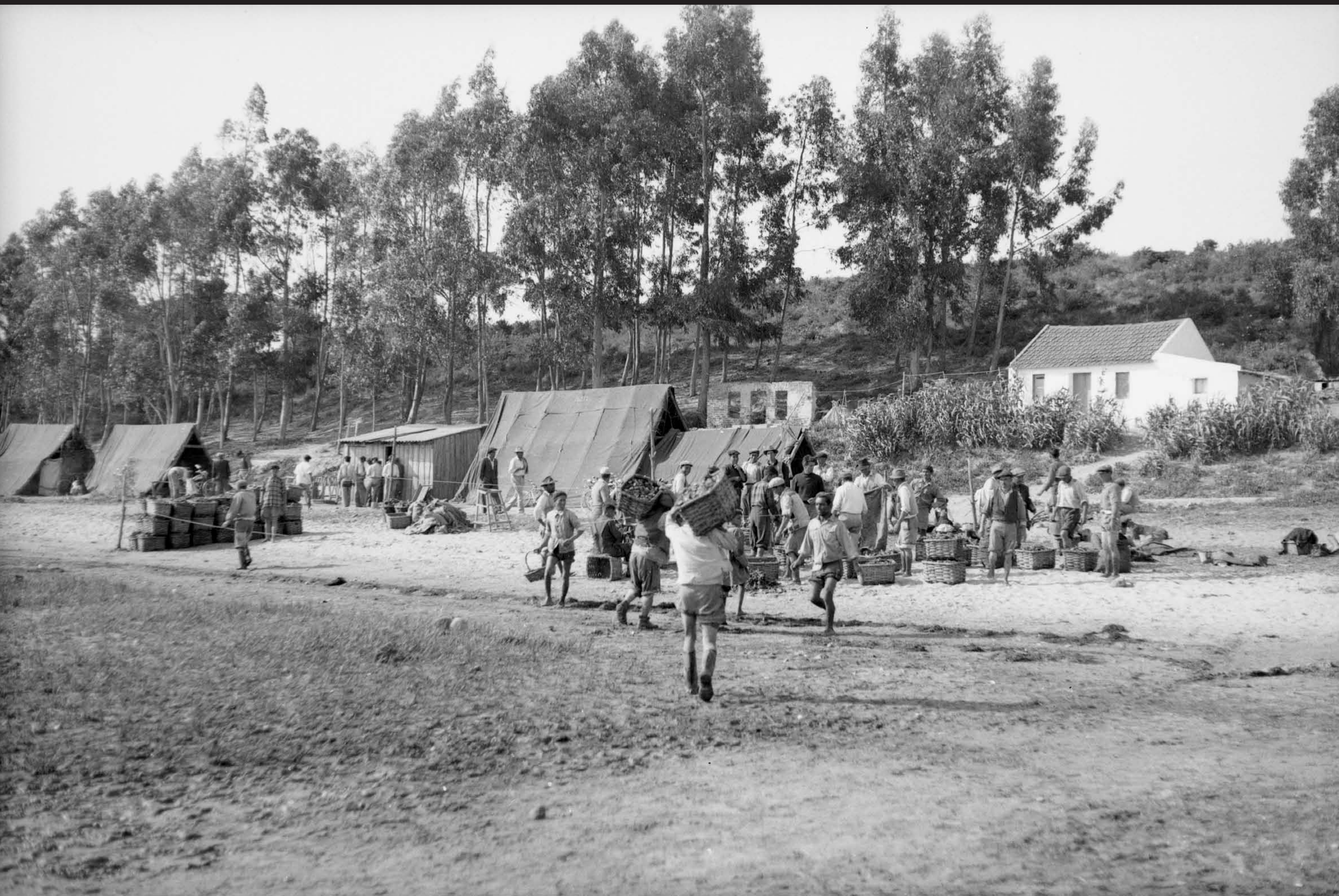
Américo Ribeiro, Apanha das Ostras em Santa Catarina, nº 10441, 1955 Arquivo Fotográfico Américo Ribeiro | Divisão de Museus | Câmara Municipal de Setúbal