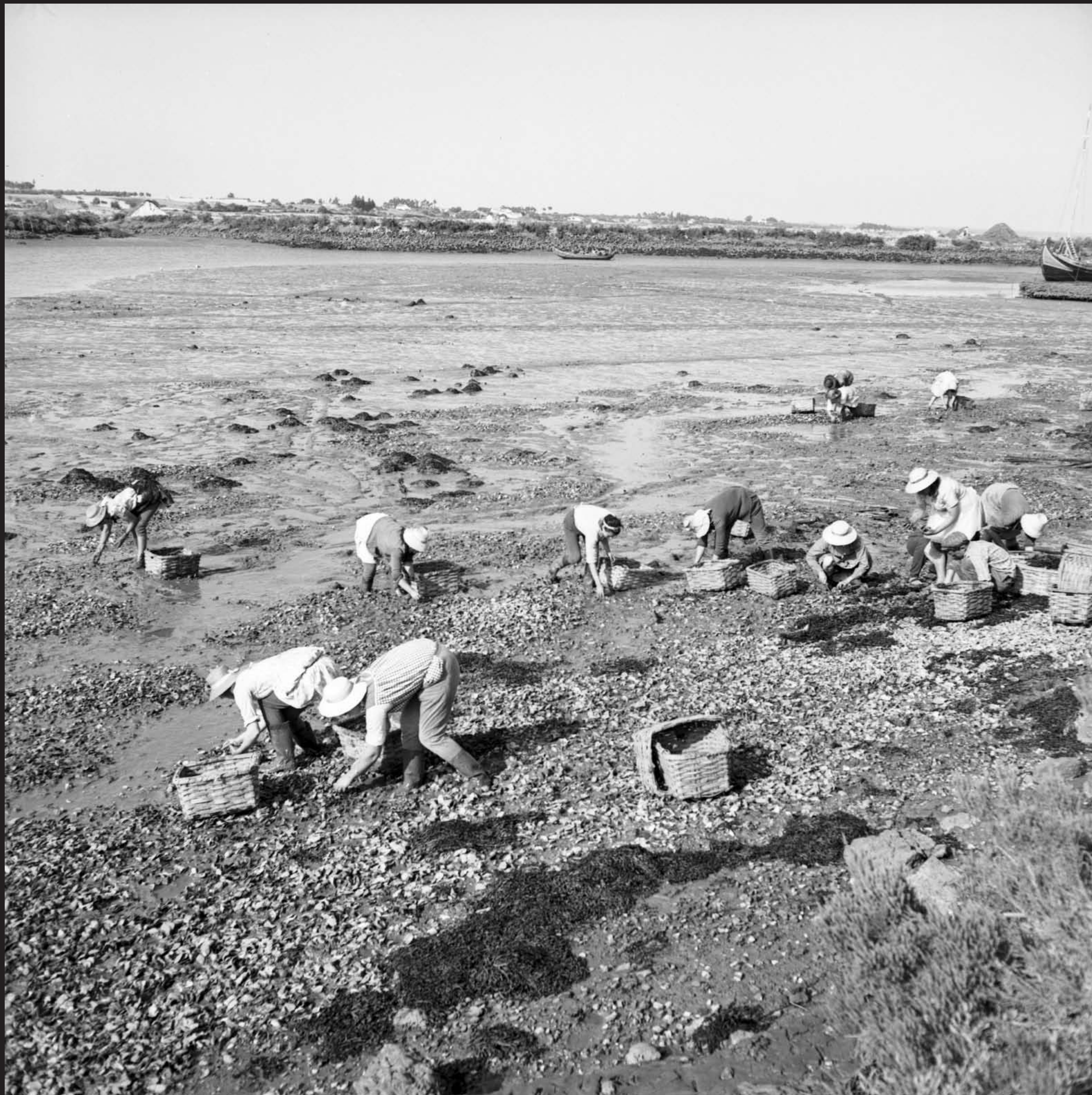
Américo Ribeiro, Apanha das Ostras em Santa Catarina, nº 10441, 1955 Arquivo Fotográfico Américo Ribeiro | Divisão de Museus | Câmara Municipal de Setúbal