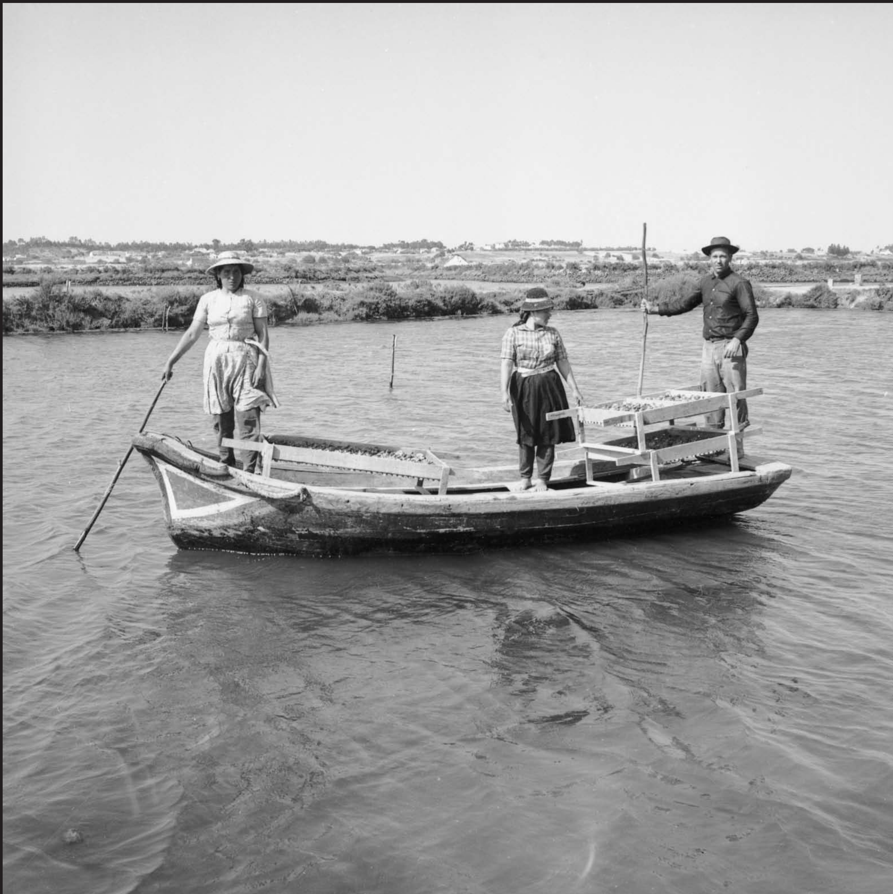
Américo Ribeiro, Ostreiras de Sérgio Pintado (sítio Marinha da Longa), nº 13335, 1965