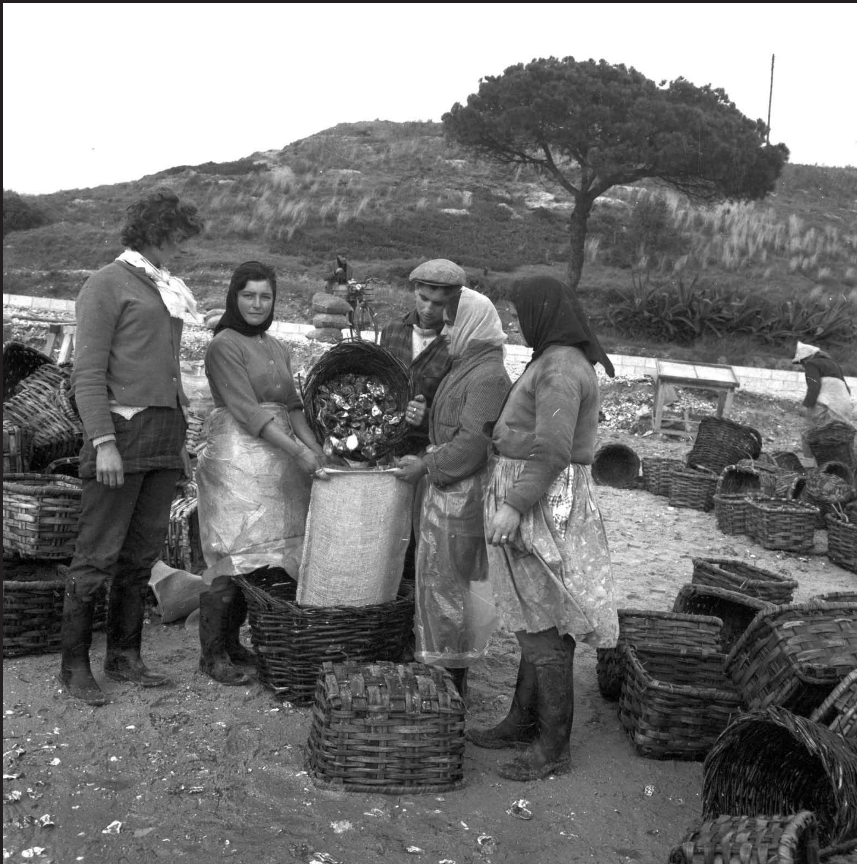
Américo Ribeiro, Ostreiras em Santa Catarina, nº 13059, 1963