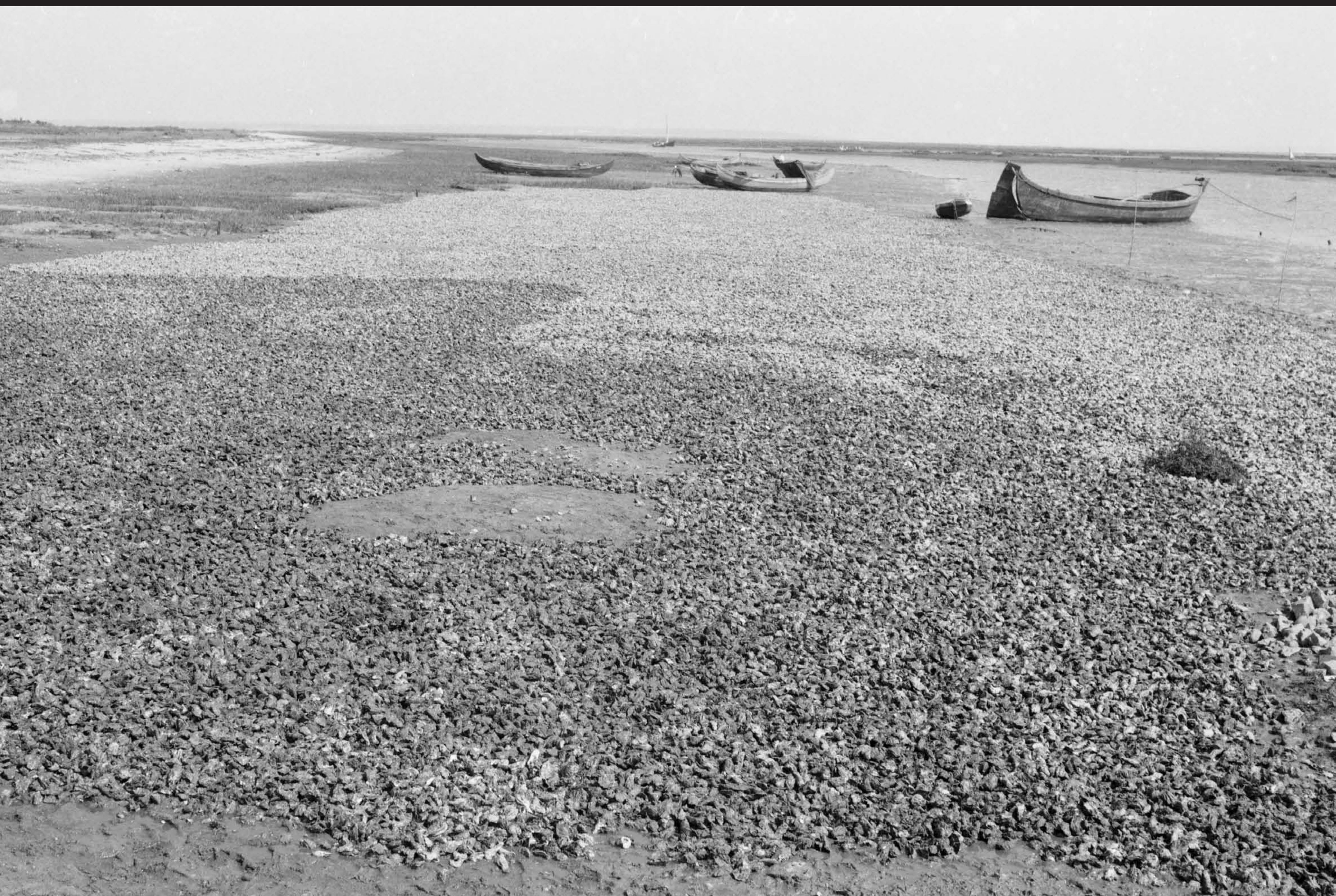
Américo Ribeiro, Apanha das Ostras em Santa Catarina , nº 10441, 1955 Arquivo Fotográfico Américo Ribeiro | Divisão de Museus | Câmara Municipal de Setúbal