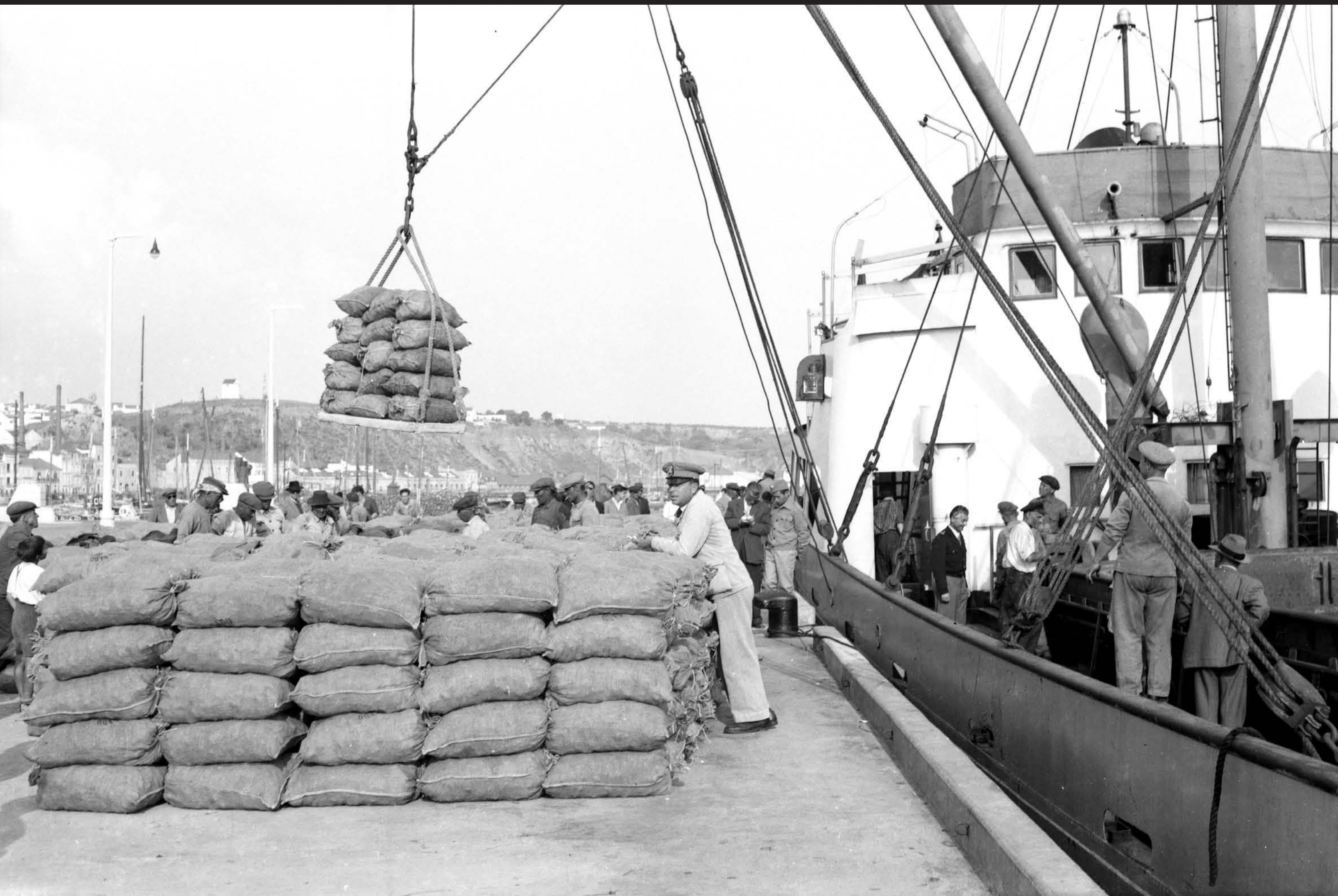
Américo Ribeiro, Apanha das Ostras em Santa Catarina, nº 10441, 1955