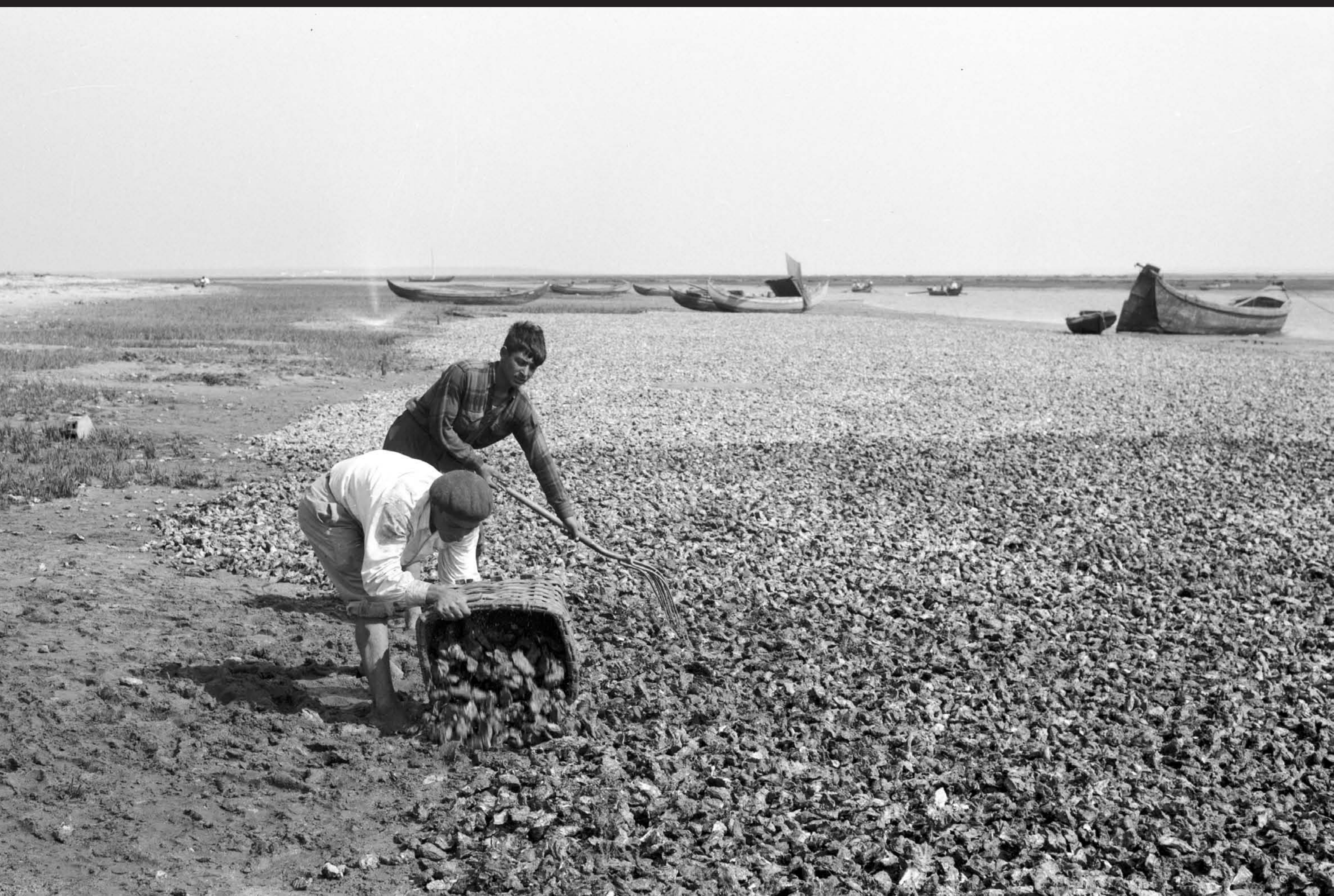
Américo Ribeiro, Apanha das Ostras em Santa Catarina, nº 10441, 1955 Arquivo Fotográfico Américo Ribeiro | Divisão de Museus | Câmara Municipal de Setúbal