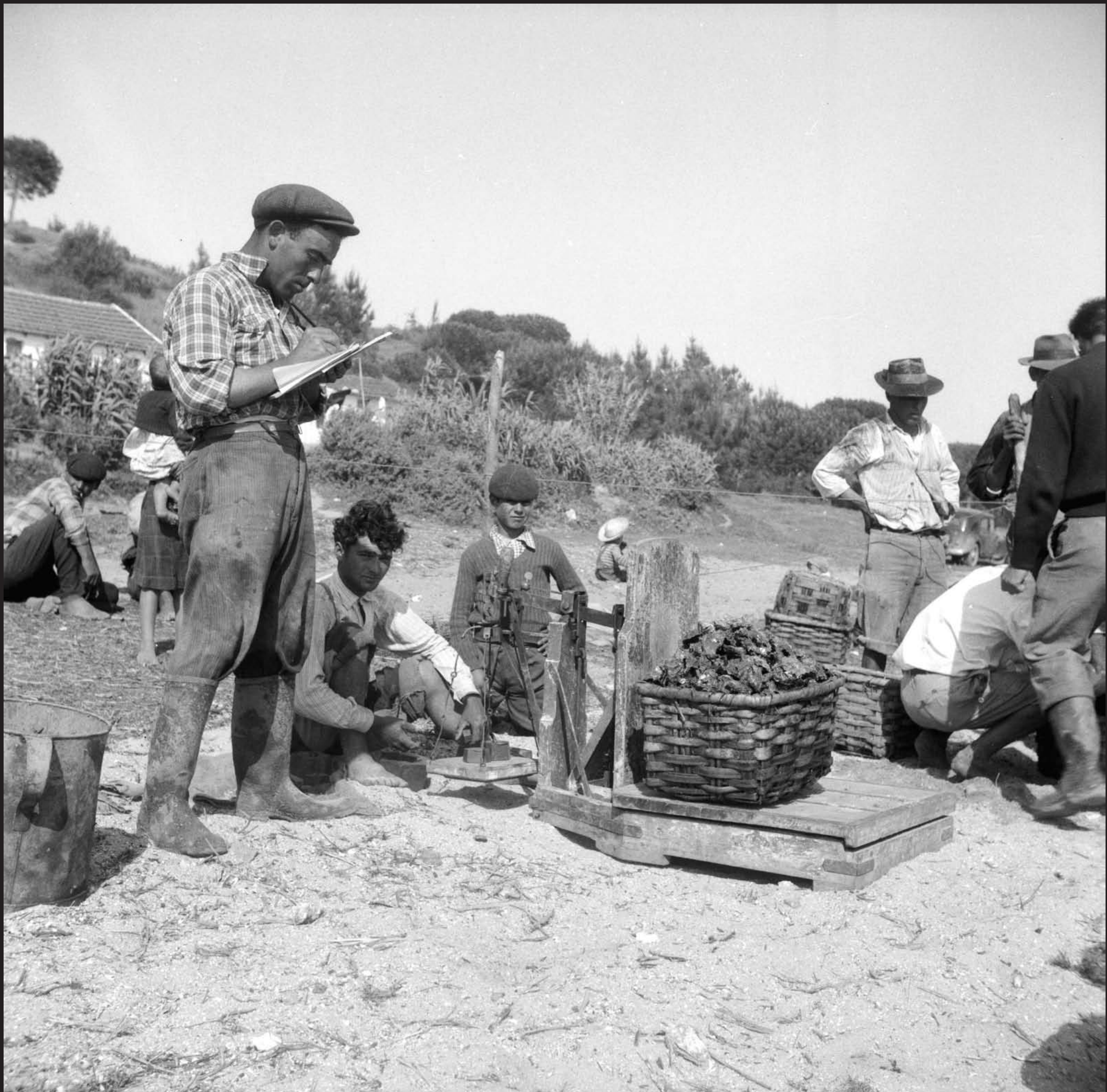
Américo Ribeiro, Apanha das Ostras em Santa Catarina, nº 10441, 1955 Arquivo Fotográfico Américo Ribeiro | Divisão de Museus | Câmara Municipal de Setúbal