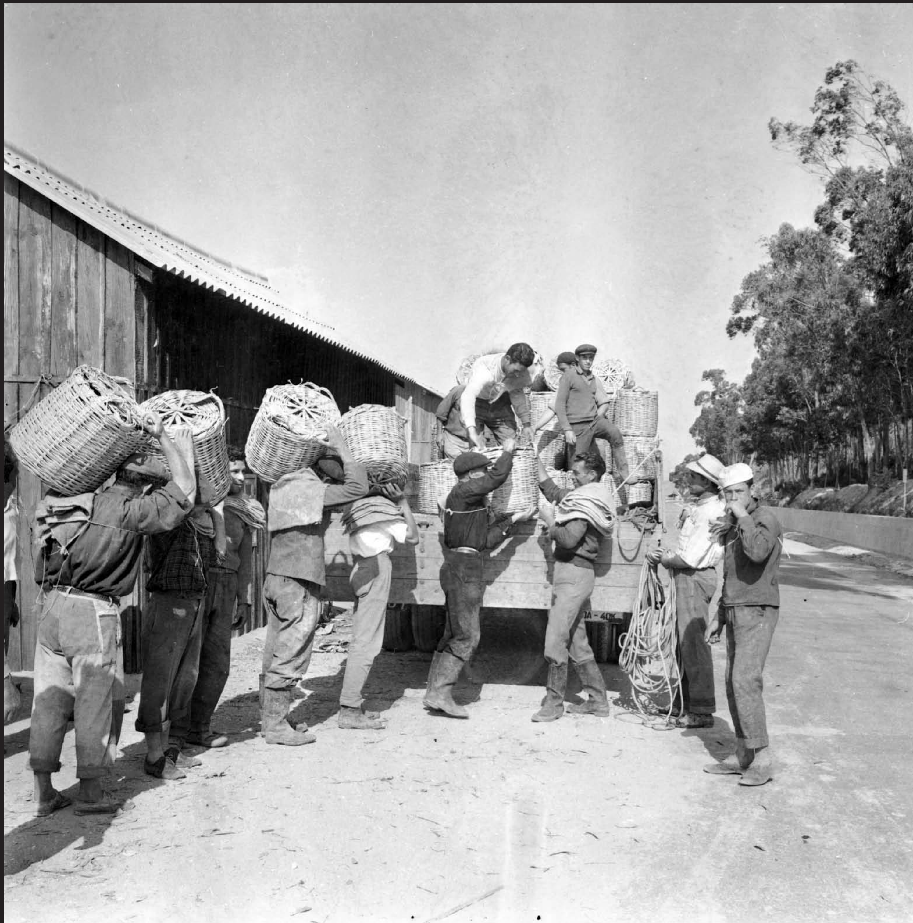
Américo Ribeiro, Apanha das Ostras em Santa Catarina, nº 10441, 1955 Arquivo Fotográfico Américo Ribeiro | Divisão de Museus | Câmara Municipal de Setúbal