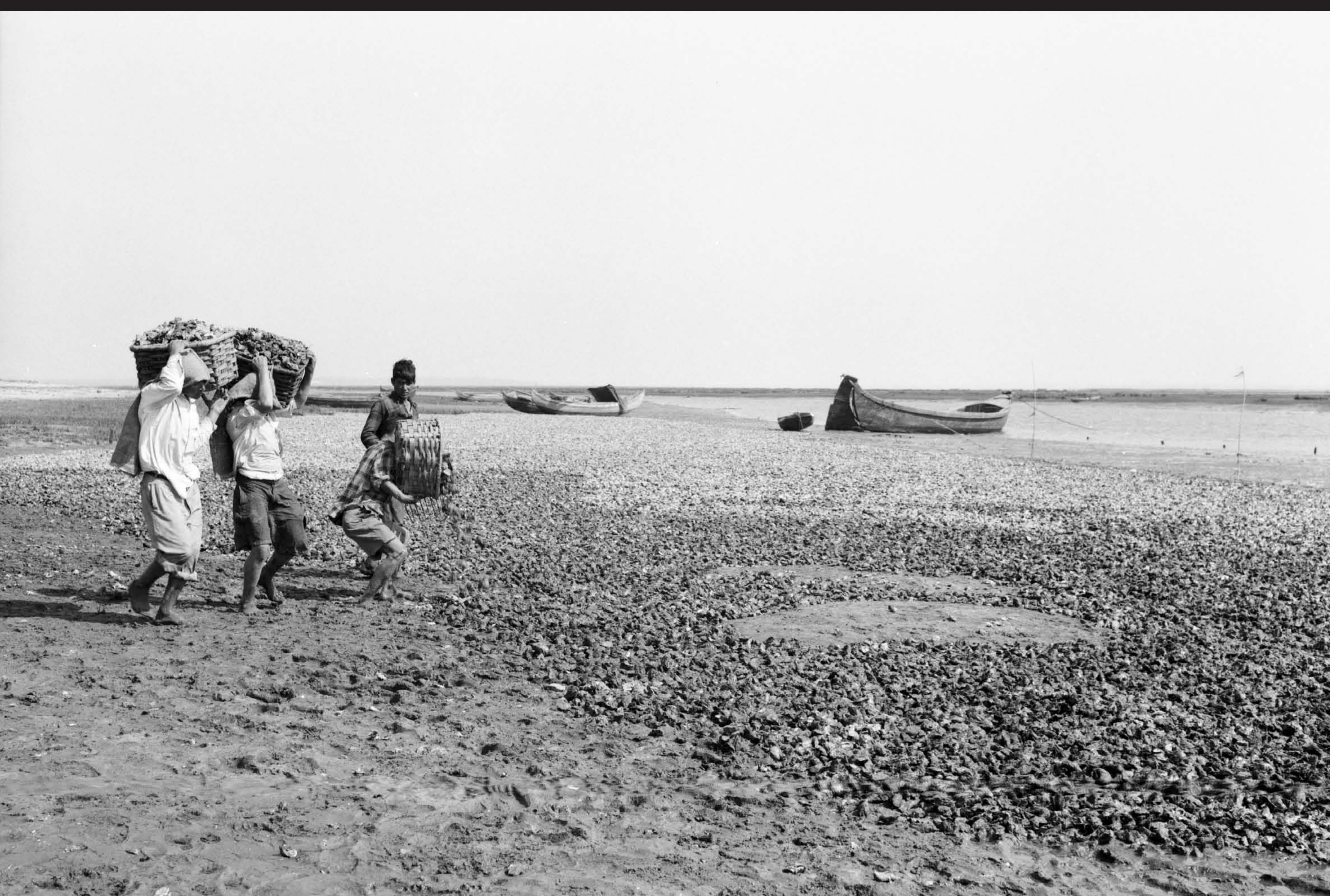
Américo Ribeiro, Apanha das Ostras em Santa Catarina, nº 10441, 1955 Arquivo Fotográfico Américo Ribeiro | Divisão de Museus | Câmara Municipal de Setúbal