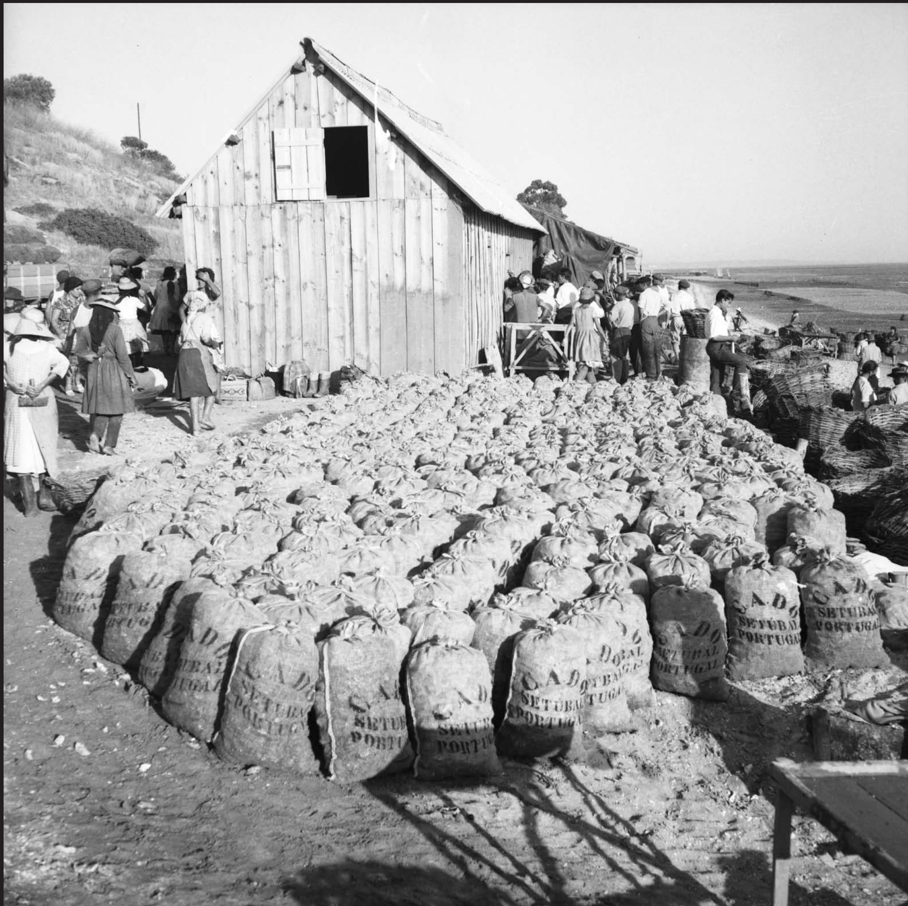
Américo Ribeiro, Ostreiras em Santa Catarina, nº 13059, 1963