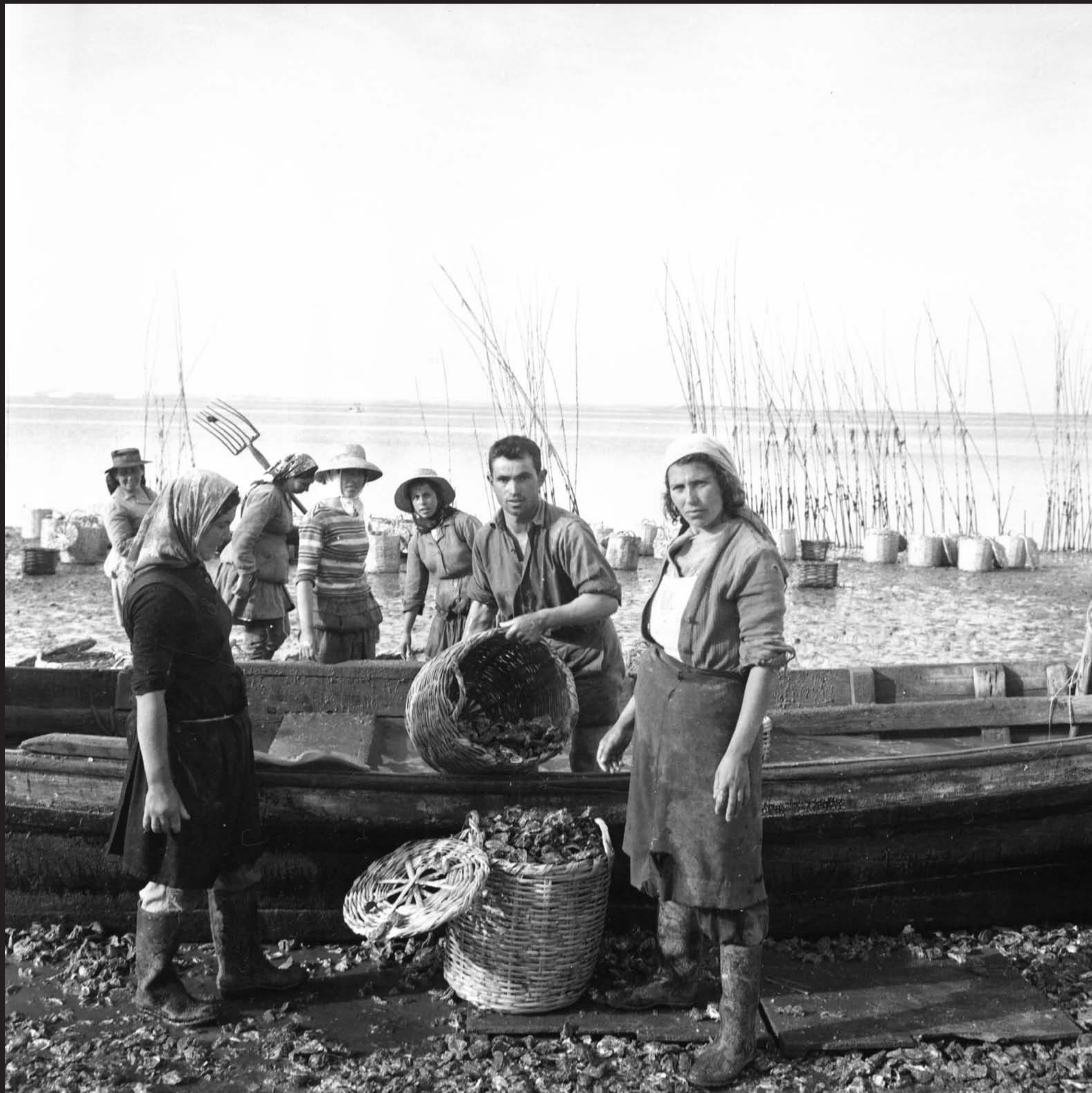
Américo Ribeiro, Ostreiras em Santa Catarina, nº 13059, 1963 Arquivo Fotográfico Américo Ribeiro | Divisão de Museus | Câmara Municipal de Setúbal