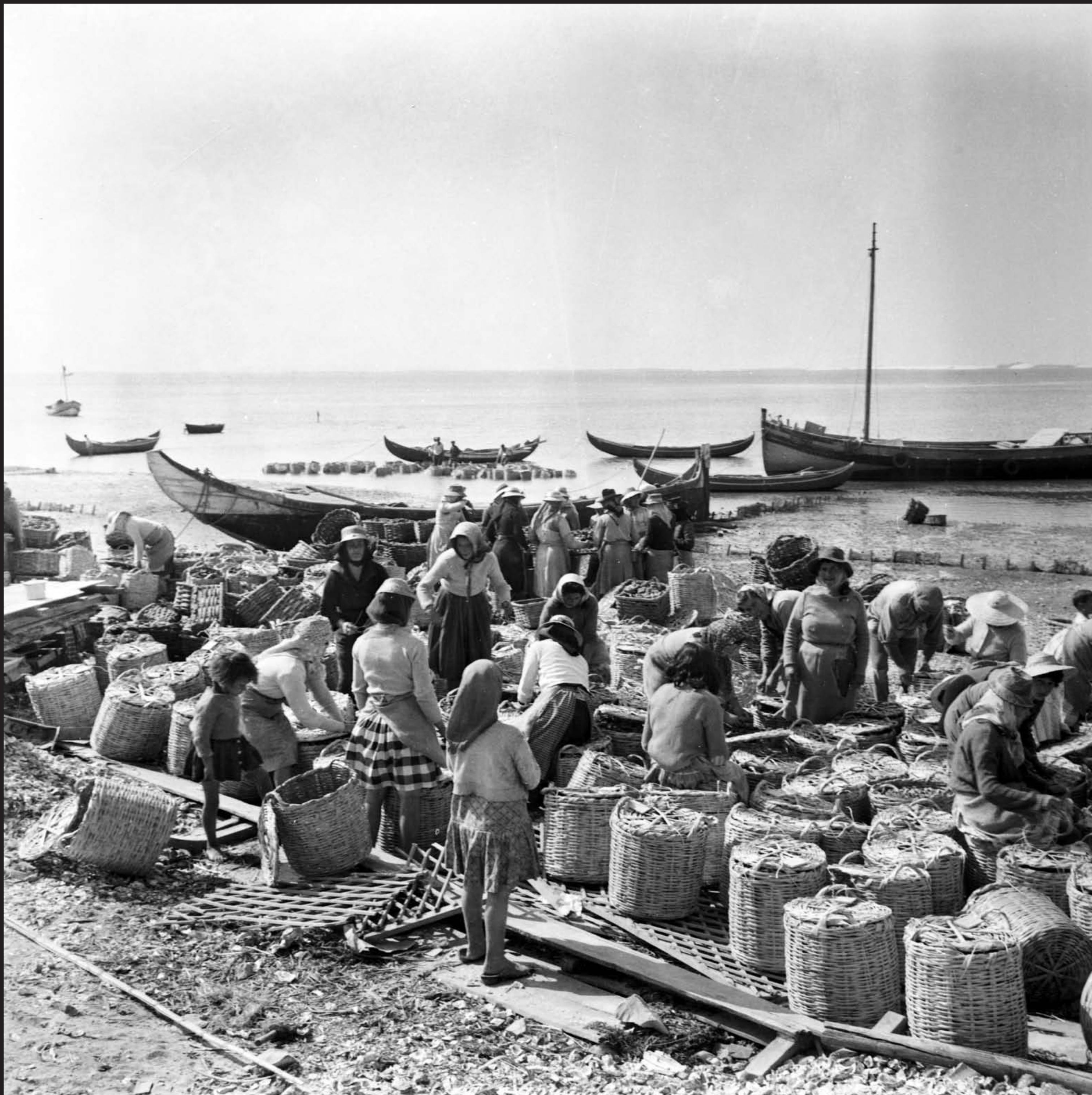
Américo Ribeiro, Ostreiras em Santa Catarina, nº 13059, 1963 Arquivo Fotográfico Américo Ribeiro | Divisão de Museus | Câmara Municipal de Setúbal