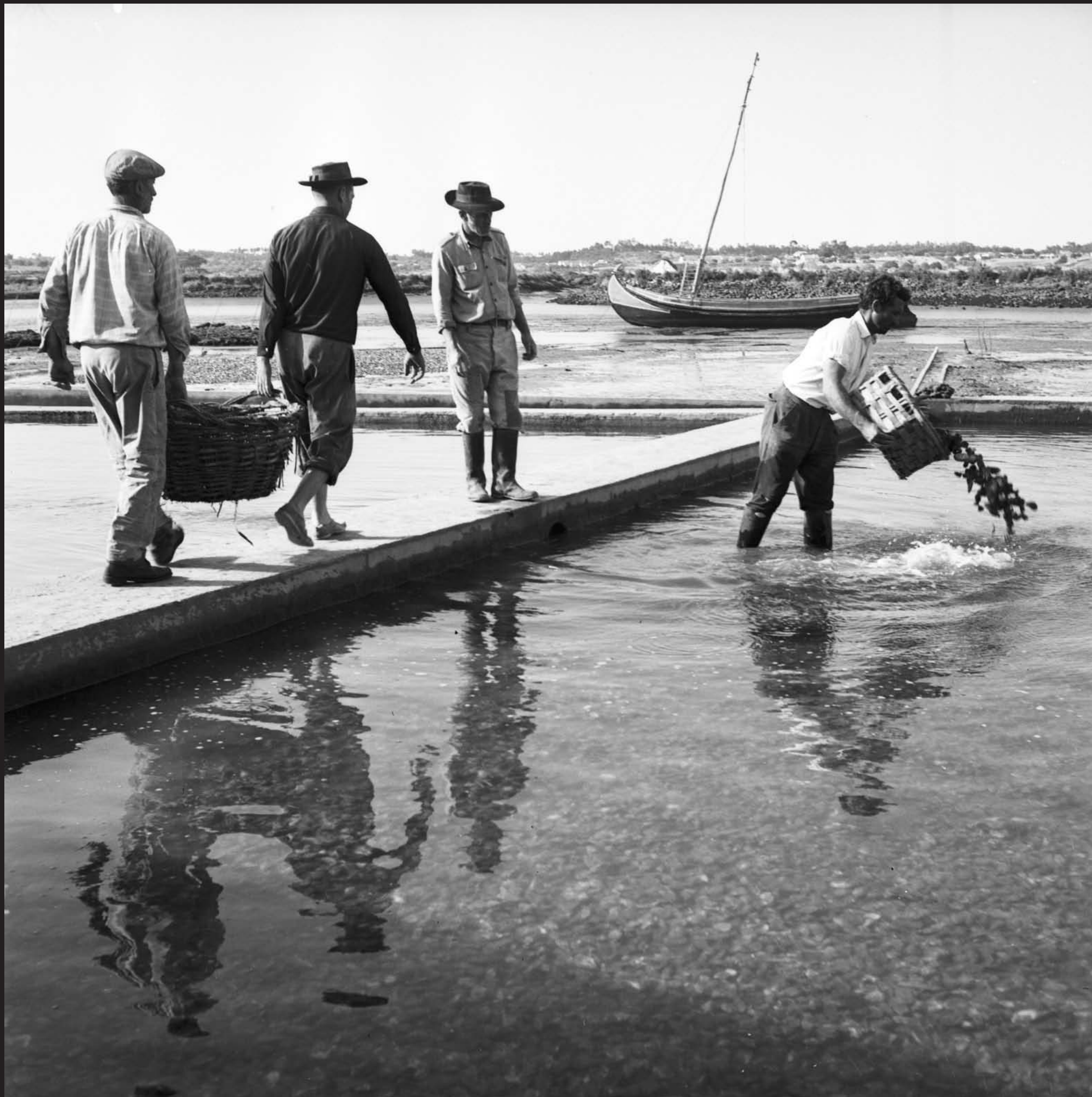
Américo Ribeiro, Apanha das Ostras em Santa Catarina, nº 10441, 1955