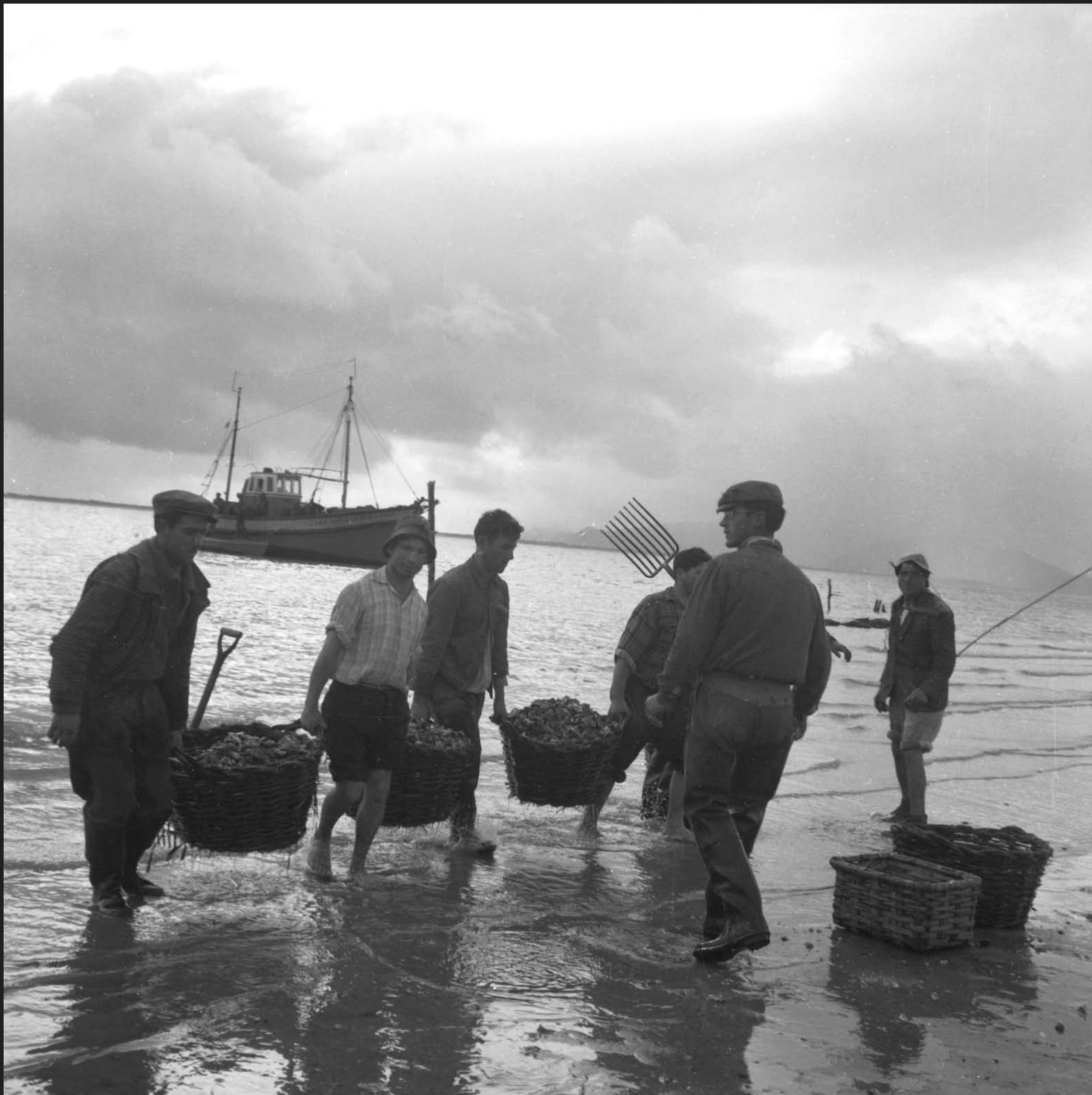
Américo Ribeiro, Apanha das Ostras em Santa Catarina , nº 10441 , 1955 Arquivo Fotográfico Américo Ribeiro | Divisão de Museus | Câmara Municipal de Setúbal