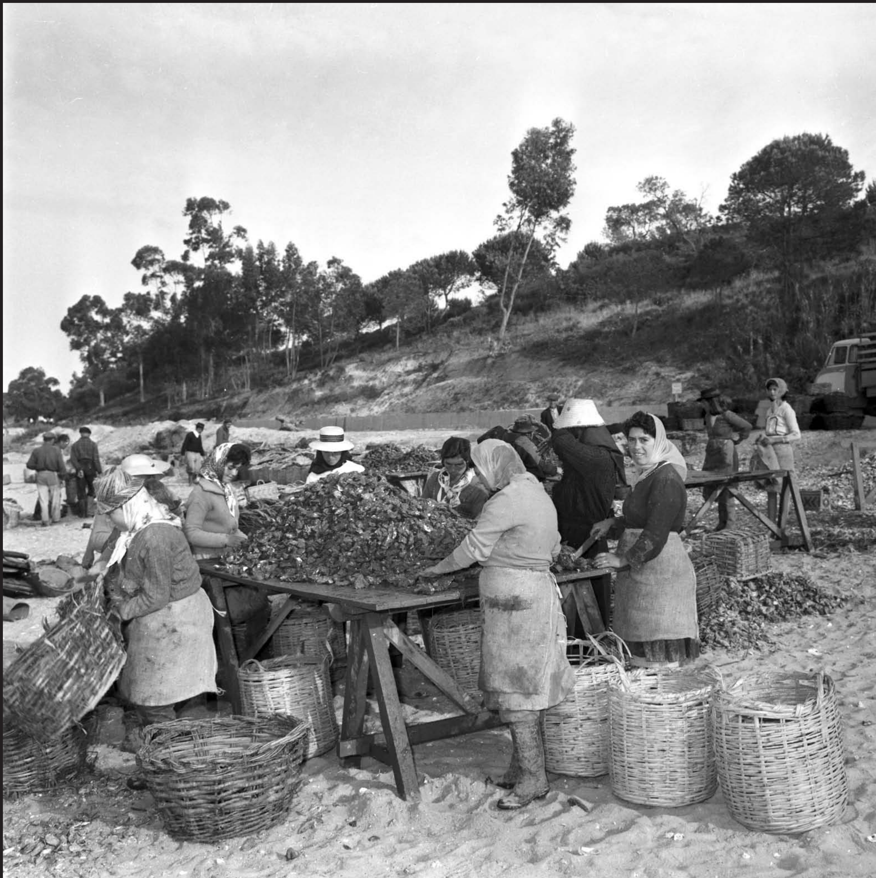
Américo Ribeiro, Ostreiras na Mitrena, nº 13110, 1964