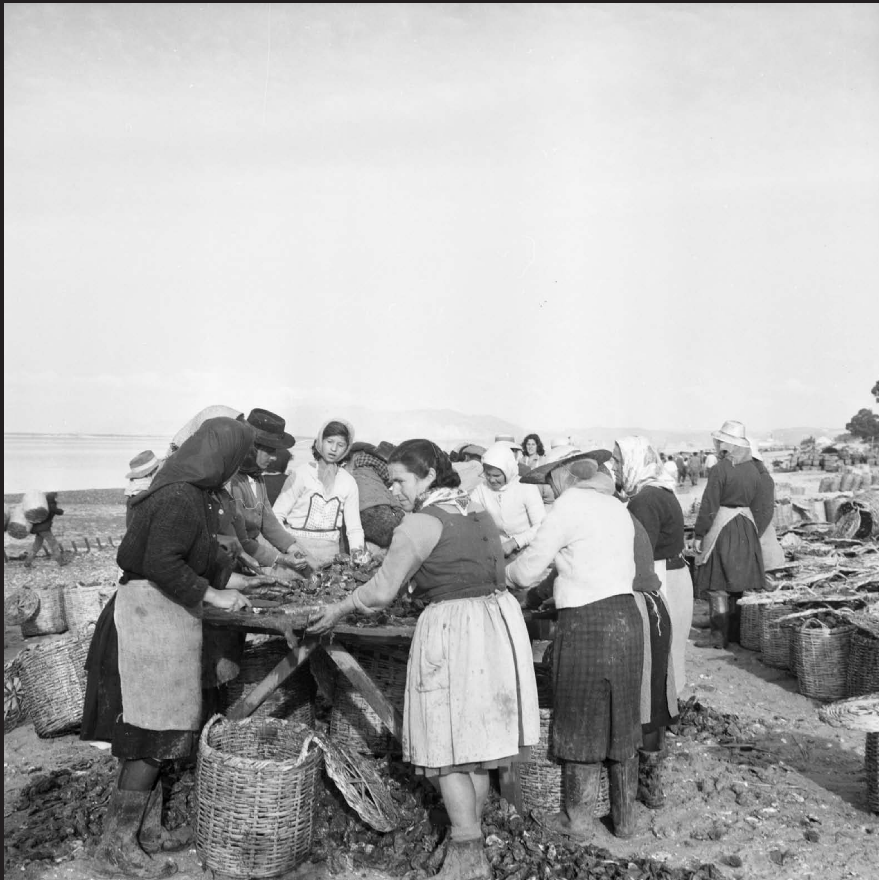
Américo Ribeiro, Ostreiras na Mitrena, nº 13110, 1964