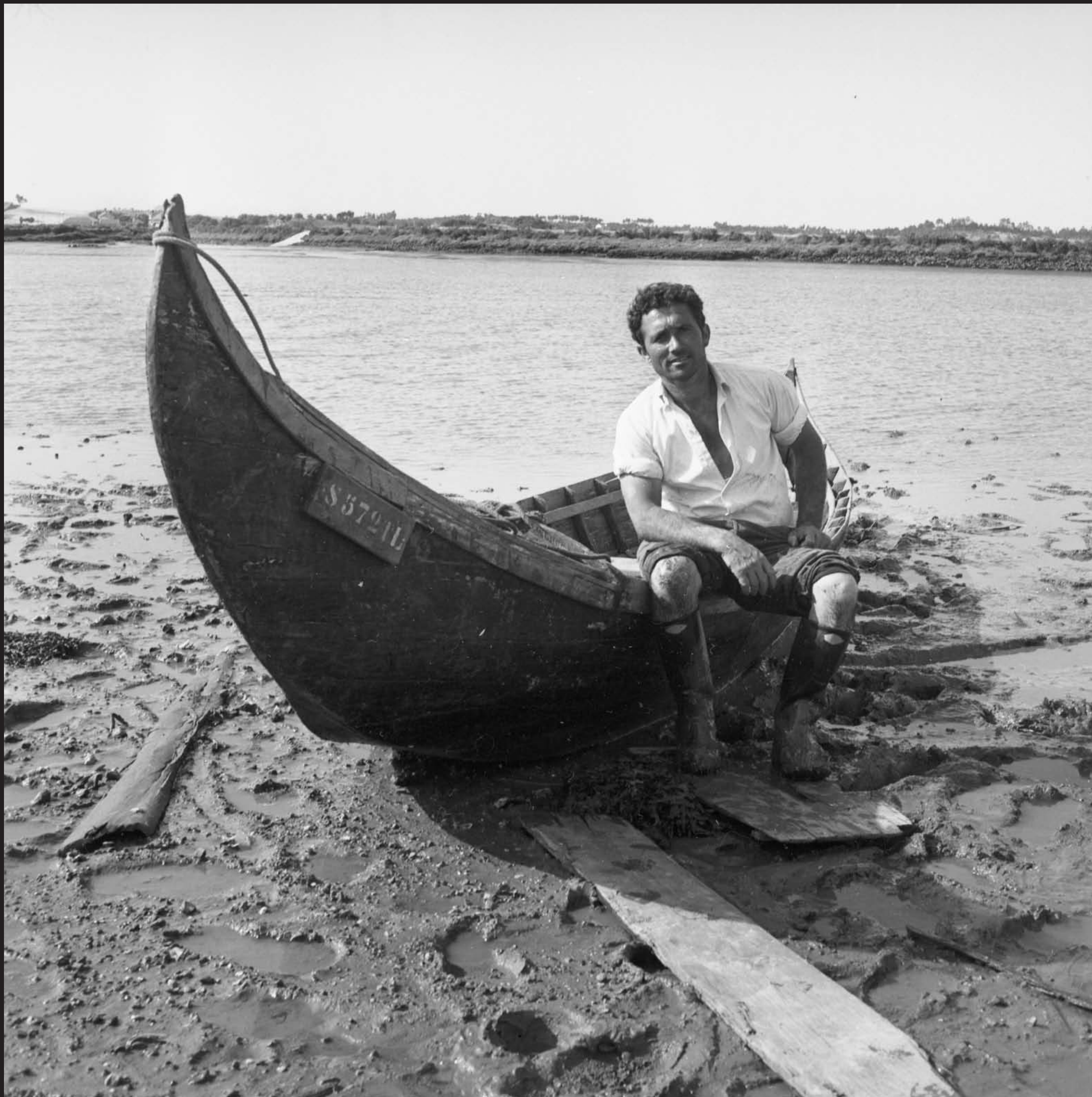
Américo Ribeiro, Ostreiras de Sérgio Pintado (sítio Marinha da Longa), nº 13335, 1965 Arquivo Fotográfico Américo Ribeiro | Divisão de Museus | Câmara Municipal de Setúbal